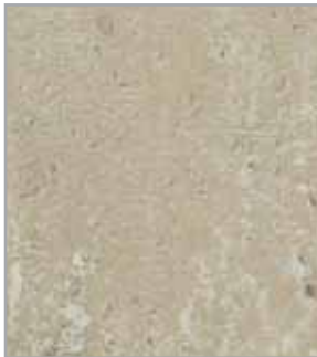
Cemento natural EP - 091 - IS