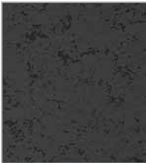
Piedra carbón EP - 090 - PI