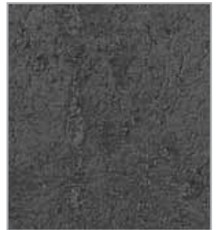
Cemento oscuro EP - 092 - IS