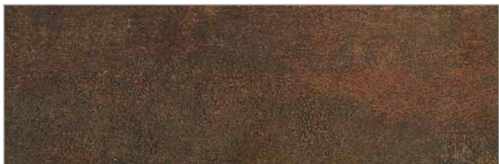
Fresko 51301 EP - 086 - IS