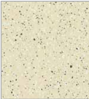
Lunar claro EP - 023 - MT